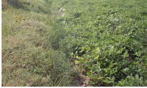
Casuarina trees along with conservative farming – Salsa Small Group

It is very important to have the name board in every grove. Immediately after the quantification, the TIST quantifier will take a photograph of every grove. While taking the photograph of the grove, group members should position themselves near the grove name board pole, so that, every photograph of the groves will have the image of the group members, name board and of course the trees. The TIST quantifier will be starting the next round quantification during the mid of May 2005, by that time, every small group should have placed the name board in their groves. Name board should have the Name of the Village, Name of Group and Name of the Grove.