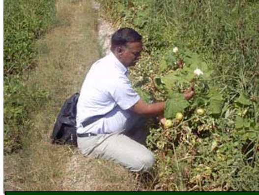
Casuarina trees along with conservation farming – Salsa Small Group

You all say that, if you plant species other casuarinas and eucalyptus, the number of trees per acre will be very little and that will affect the voucher amount (earning). TIST says that, there will not be any difference in the yearly earnings if the selection of species is done prudently. Plant trees like, Mango, Guava, Tamarind, Sapota, Cotton, etc. These trees will get a great earning once in a year, which is other the TIST voucher payment. More over, conservative farming is not being followed currently. You can also have short time crops like, chilly, ladies finger, brinjal, etc. in between the trees during the initial stage of the trees, i.e., 6 months to 1 year. Salsa, Chandiran, SindhuKavi small groups followed the conservative farming and they had a great benefit of the conservative farming during the initial stage. If useful trees are planted and conservative farming is followed, there will not be any difference in earnings between the small group which has casuarinas/eucalyptus and the small groups which has fruit bearing trees.