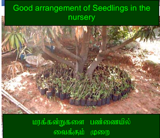
Good arrangement of Seedlings in the nursery