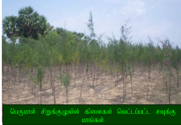
பெருமாள் சிறுக்குழுவின்கிளைகள் வெட்டப்பட்ட சவுக்கு மாங்கள்

சல்சா மற்றும் பெருமாள் சிறுக்குழுக்களின் கூடுதல் வருமானம்