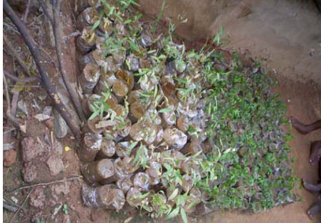
மரக்கன்றுகளை பண்ணையில் வைக்கும் முறை

மரக்கன்றுகள் செட்டம்பர் இறுதி வரை பால்தீன் பைகளில் வைக்கப்பட வேண்டும். மரம் நடுவது அக்டோபர் மாதத்தில் இருக்க வேண்டும். அக்டோபர் முதல் டிசம்பர் வரை மழையும் பனிக்காலமும் ஆகும். புதிய மரங்கள் நன்றாக வளரக்கூடிய காலமிது. பாதிப்புகளும் குறைவாகவே இருக்ககும். அடுத்த கோடைக்குள் மரக்கன்றுகள் நன்றாக வளர்ந்து கோடையை சமாளித்துக் கொள்ளும்.