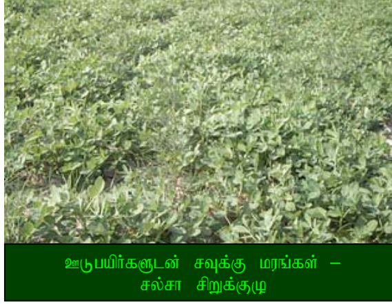
ஊடுபயிர்களுடன் சவுக்கு மரங்கள் – சல்சா சிறுக்குழு

ஒவ்வொரு தோப்பிலும் பெயர்ப் பலகை இருத்தல் மிக அவசியம் ஆகும். அளவீட்டிற்கு பிறகு கணக்கீட்டாளர் ஒரு புகைப்படம் எடுத்து ஒவ்வொரு தோப்பின் வளர்ச்சியையும் பதிவு செய்வார். அவ்வாறு புகைப்படம் எடுக்கும் பொழுது, சிறுக்குழுவின் உறுப்பினர் ஒருவர் பெயர்ப்பலகை அருகே இருக்க வேண்டும். அம மாதத்தின் மையத்தில் கணக்கீட்டாளர் இவ்வாறு பதிவு செய்யத்துவங்குவார். அப்பொழுது எல்லாச் சிறுக்குழுவிலும் கட்டாமாக பெயர்பலகை இருக்க வேண்டும். பெயர்பலகையில் கிராமத்தின் பெயர், குழுவின் பெயர் மற்றும் தோப்பின் பெயர் ஆகியவை இடம் பெற்றிருக்க வேண்டும்.