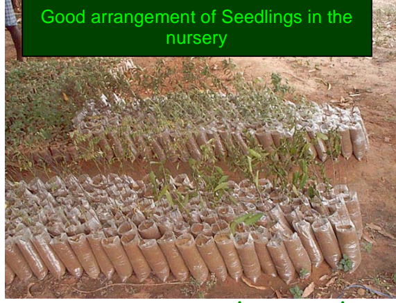
Good arrangement of Seedlings in the nursery

மரக்கன்றுகள் செட்டம்பர் இறுதி வரை பால்தீன் பைகளில் வைக்கப்பட வேண்டும். மரம் நடுவது அக்டோபர் மாதத்தில் இருக்க வேண்டும். அக்டோபர் முதல் டிசம்பர் வரை மழையும் பனிக்காலமும் ஆகும். புதிய மரங்கள் நன்றாக வளரக்கூடிய காலமிது. பாதிப்புகளும் குறைவாகவே இருக்ககும். அடுத்த கோடைக்குள் மரக்கன்றுகள் நன்றாக வளர்ந்து கோடையை சமாளித்துக் கொள்ளும்.