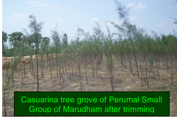
Casuarina tree grove of Perumal Small Group of Marudham after trimming

There are few small groups like Salsa & Chandiran of Mel Kodungular and Perumal of Marudham who are with TIST for more than two years. These three small groups have more than 1.25 lakhs casuarina trees. These casuarinas trees have grown more than 10 feet in height. The wise act of these three small groups have fetched them more than Rs.30,000/-, this is other than the TIST Voucher Payment. The members have trimmed the side branches of the casuarinas trees, so that the tree grows fast upwards. These trimmed branches fetched them considerable amount. Casuarina trees gets only two such payments, but if it is a fruit bearing, the additional earnings will be every year, for instance, Balaji Small Group earns more than Rs.15,000/- every year from the Cotton trees, which is other than TIST Voucher Payment.