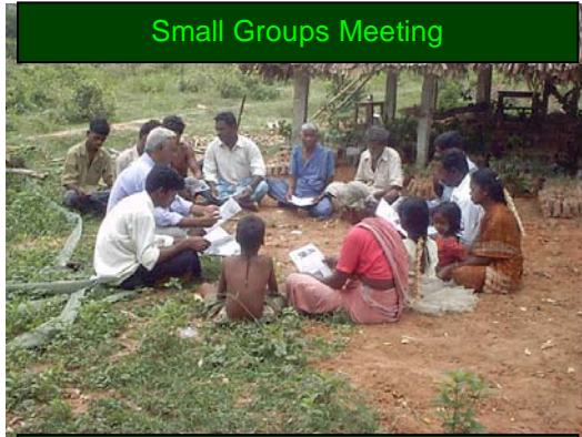
Small Groups Meeting

பண்ணையை தொடங்கும் முன் தங்கள் சிறுக்குழுவிற்ருள்ளேயே ஒரு கூட்டத்திற்கு ஏற்பாடு செய்து நிலவளம், சீதோசணம் நிலை, நீர் வளம் போன்றவற்றை பற்றி விவாதித்து எந்த வகையான மரக்கன்றுகளை வளர்க்கலாம் என முடிவு செய்தல் மிக மிக அவசியம். பழங்களை தரக் கூடிய மரங்களையும், வாழக்கூடிய மரங்களையும் வேண்டும் என TIST