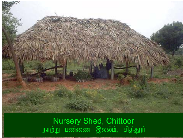
Nursery Shed, Chittoor நாற்று பண்ணை இலலம், சித்தூர்

more than hundreds of intermixture of seedlings for their future needs. Seedlings like, Casuarina, Eucalyptus, Neem, Lemon, Agathai, Drum Stick are conserved under a shed and regular watering, and rich manure is used for healthy growth. One of the small group leaders of this village says that, from now there will not be any causality in the seedlings by direct sun light.