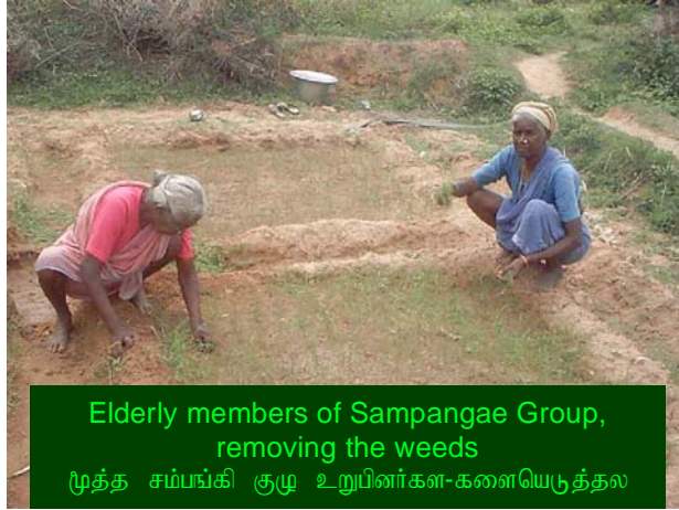
Elderly members of Sampangae Group, removing the weeds முத்த சம்பங்கி குழு உறுப்பினர்களைகொண்டிருந்தல்

This group was registered as Small Group along with Chamundhi Group on 28.04.2004. The beginning of this group looks to be a real contest with the existing groups. One month after registration, this group now owns more than 10,000 casuarina seedlings. In the end of April 2004, casuarina seeds were sowed and on 23.05.2004 the 3-4 inch shoots were transplanted on the light and porous soil beds of their nursery. These shoots will again be transplanted to a different land with minimum 2 m spacing all sides. Other than casuarina, they are planning to plant fruit bearing trees like mango, pala and goava.