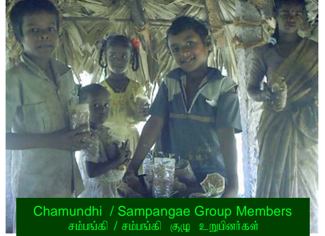
Chamundhi / Sampangae Group Members சம்பங்கி / சம்பங்கி குழு உறுப்பினர்கள்

சித்தூர் கிராமத்தில், சிந்துகவி, காவேரி, சம்பங்கி, மற்றும் சாமந்தி போன்ற சிறு குழுக்கள் கூட்டாக அவர்களின்