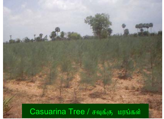
Casuarina Tree / சவுக்கு மரங்கள்

இந்த மரம் சாதாரணமாக விதைகளின் மூலம் பரவும். இந்த விதைகள் எப்போதும் நவம்பர் மாதத்தில், நண்கு பராமரிக்கப்பட்டு உரமிடப்பட்ட நாற்று பண்ணைகளில் விதைக்கப்படும். ஒரு ஏக்கர் சவுக்கு தோப்பிற்கு 1/2 கிலோ விதைகள் தேவைப்படும். நாற்றுப் பண்ணைகள் குரிய ஒளி படக்கூடியதாகவும், தரமான மண், சாம்பல், உரம் சீராக கலந்து உருவாக்கப்பட்டவையாகும். விதைப்பருகைகள் தண்ணீர் ஊற்றி நண்கு பராமரிக்கப்பட்டிருக்கும். அவைகள் பூச்சி கொல்லி மருந்துகள் தெளிக்கப்பட்டு, வெட்டுக்கிளி, மற்றும் எறும்பு போன்றவைகள் விதைகளை எடுத்துச் சென்றுவிடாத படி பாதுகாக்கப்பட்டிருக்கும். விதைகள் முளைவிடுவது 7 முதல் 10 நாட்களில் தொடங்கி, 30 நாட்களில்