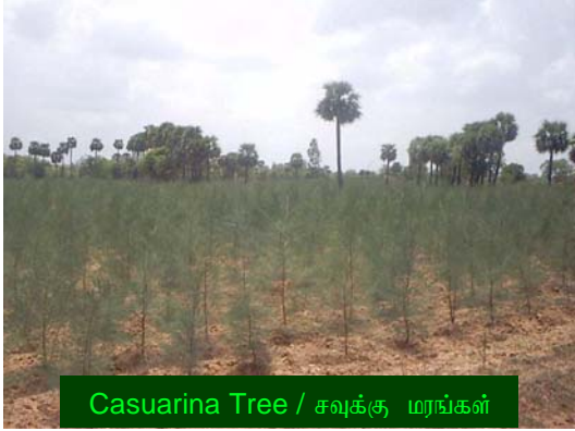
Casuarina Tree / சவுக்கு மரங்கள்

The tree is normally propagated through seeds. The seed is sown usually in November, in well-prepared and manured nursery beds. One hectare of casuarina planted area requires about 1/2 kg seeds for nursery sowing. The nursery beds are made up of light and porous soil mixed with fine manure and ash and levelled. The beds are watered with a fine 'rose' to prevent washing off. They are sprayed with Gamexane or BHC around the beds to prevent caterpillars, mole-crickets and ants from carrying away the seeds. The germination starts in 7-10 days and is complete in about 30 days. Early and complete germination is obtained if the beds are covered with straw or palm-