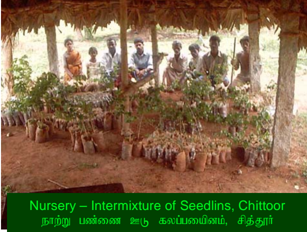
Nursery – Intermixture of Seedlings, Chittoor நாற்று பண்ணை ஊடு கலப்பயினம், சித்தூர்

In Chittoor Village, few Small Groups like, Sindhukavi, Kaveri, Sampangae and Chamundhi have jointly started a Nursery on 23.05.2004 with