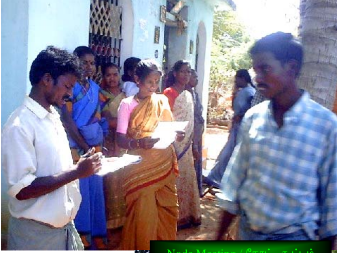
Node Meeting / நோட் கூட்டம்

arrived, and I really felt welcome ” or “I really liked how you encouraged us all to speak, but also kept the discussion moving.” or “You pointed out something that was going very well in the meeting.”