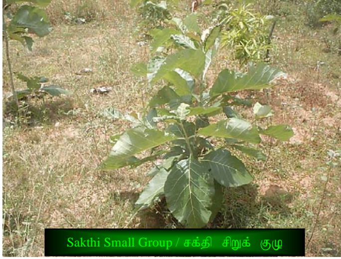
Sakthi Small Group / சக்தி சிறுக் குழு

Now, after joining TIST, Sakthi Small Group have started planting multiple species of trees like Drum Stick, Neem, Teak, Goava, and Orange. These new trees are planted in between their earlier distantly planted mango trees. 252 Teak Trees are planted separately in an area of 3,200 sq.ft. Presently, they have 325 Drum Stick, 126