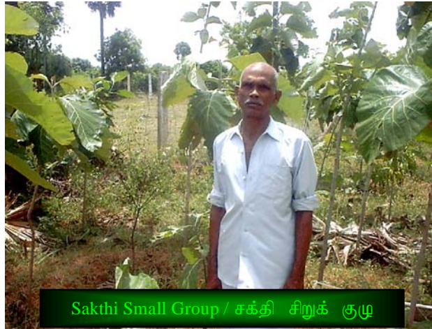
Sakthi Small Group / சக்தி சிறுக் குழு