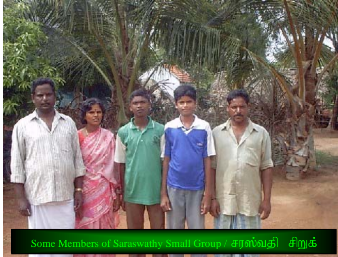
Some Members of Saraswathy Small Group / சரஸ்வதி சிறுக்குழு

This Small Group was registered on 15.06.2003 under TIST Program. Before joining TIST the members of this small group were involved in cultivation of fruits and selling them at the Sungvachatiram market. When the TIST Officials approached Sokandi Village for recruiting Small Groups, the villager's fruit trade was almost at standstill due to short in rainfall.