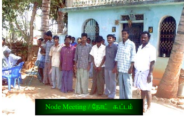
Node Meeting / நோட் கூட்டம்

In response to Building Up, that week's servant leader just says, "Thank you" after each group member's specific, positive statement. There is no discussion about how it could have been done better, or differently. Sometimes this is awkward at first. Be sure to stick with it. When the small group becomes accustomed to Building Up, everyone looks forward to this part of the meeting.