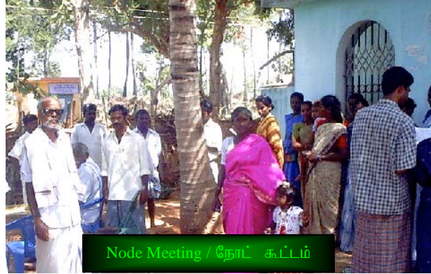
Node Meeting / நோட் கூட்டம்