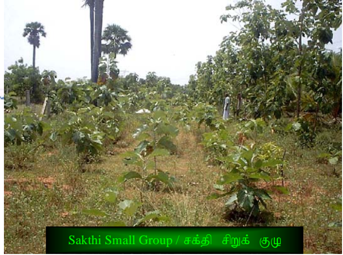
Sakthi Small Group / சக்தி சிறுக் குழு

TISI - ல் சேர்ந்த பிறகு, இக்குழு முருங்கை, வேம்பு, கொய்யா, ஆரஞ்சு போன்ற பல்வேறு வகையான மரங்களை நடவு செய்து வருகிறார்கள். அவர்கள் ஏற்கனவே பயிரிட்டிற்கும் மாமரங்களுக்கும் இடையே இம்மரங்கள் நடவு செய்யப்பட்டுள்ளது. 3200 சதுர அடியில் 252 தேக்கு மரங்கள் நடப்பள்ளார்கள். 325 முருங்கை மரங்களும், 126 வேம்பு மரங்கள், 252 தேக்கு மரங்களும், 35 மாமரங்கள், 13 கொய்யா மற்றும் 7 ஆரஞ்சு மரங்களும் இப்போது வளர்ந்துள்ளன. கடந்த ஒரு வருட காலத்தில் இவர்கள் மொத்தம் 758 மரங்களை வெற்றிகரமாக வளர்த்துள்ளார்கள். இக்குழுவின் தலைவர் 2000 நாற்றுக்களுடன் ஒரு புதிய பண்ணை அமைக்க உத்தரவாதம் தந்துள்ளார். எல்லா சிறுகுழுக்களும் பல்வேறு வகையான மரங்களை வளர்ப்பதே, TIST-ன் நோக்கமாகும். இதற்கு சக்தி சிறுகுழு ஒரு சிறந்த உதாரணமாகும்.