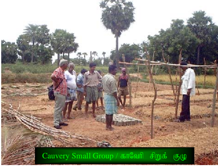
Cauvery Small Group / காவேரி சிறுக் குழு

Recently, few villagers of Chittoor have joined TIST Tree Planting Program. They have been united with Cauvery and Roja Small Group of Chittoor and Nandimedu. These two Small Groups have started a huge nursery with more than 70,000 seedlings of curry leaf. The seeds were bought from Salem. 35,000 seedlings are kept at Chittoor and another 35,000 at Nandimedu. All the seedlings are arranged orderly in groups of 1,000. Seedlings are protected well from sunlight by jute coverings, over and above a roof with straw to save from sudden cloudburst. The members say that "Yes, the water scarcity is acute, but still we will save all the seedlings with available little water by spray method. TIST congratulates these two Small Groups for their marvellous start, at the same time, TIST advises them not to trim the trees for commercial purpose and allow the trees to grow to its full height, and to concentrate in growing multiple species of trees as well. The larger a tree grows the more CO2 it reduces from the atmosphere and also it will have a good root system to hold the soil. All the small groups should adhere to this strategy to get good voucher payments.