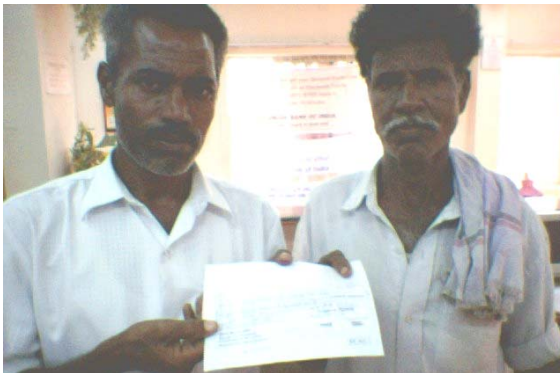
Perumal Small Group / பெருமாள் சிறு குழு

TIST is not here to encourage one single kind of trees like casuarina or eucalyptus. TIST is encouraging the Small Groups to do reforestation/afforestation. A forest means lot of trees and different types of trees, not just single kind of trees. Now you may wonder that in a forest trees and plants are very tightly grown, but why TIST does not allow you to plant trees with less spacing. The reason for having good spacing between each tree is to allow the tree to grow to good height. For example, if a mango tree is planted with good spacing, the mango tree grows at least 10 m in height with 4-5 m long side branches. This full-grown mango tree may sequester the carbon produced by one lorry per day. Suppose the spacing for the mango trees are very minimum, then the tree will grow not 10 m height and the side branches will not reach 4-5 m, automatically the carbon sequester by this tree will fall down. TIST is facilitating to have continuous funding for the Small Group Voucher payment through revenue from the carbon credits market. If the trees grown by you do not attain its normal height then how do we sequester the carbon and how do we market the carbon credits. Grow multiple species of trees and give enough spacing between each tree and enjoy the benefits from TIST.